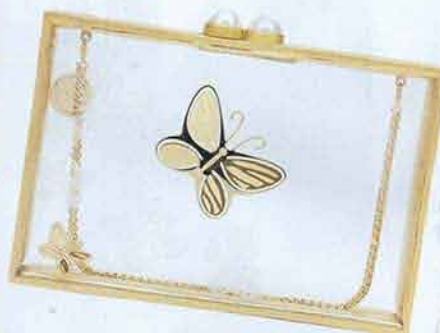
Una preziosa clutch in plexi trasparente e farfalle dorate di THALÉ BLANC . Il 20% del ricavato dalla sua vendita sarà devoluto alla ricerca contro il cancro infantile.