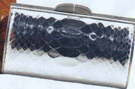
Pochette in pitone argentato e strass, THALÉ BLANC .