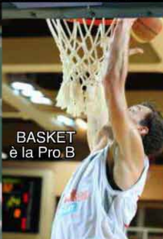
BASKET è la Pro.B