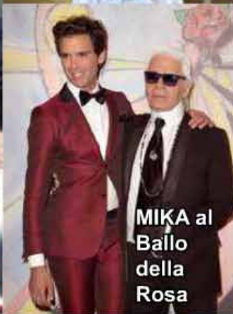
MIKA al Ballo della Rosa