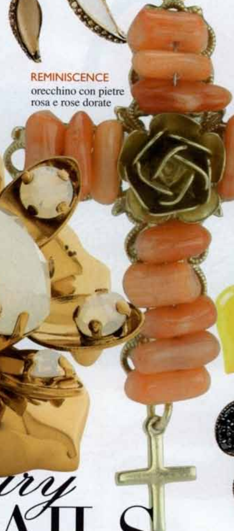
REMINISCE orecchino con pietre rosa e rose dorate