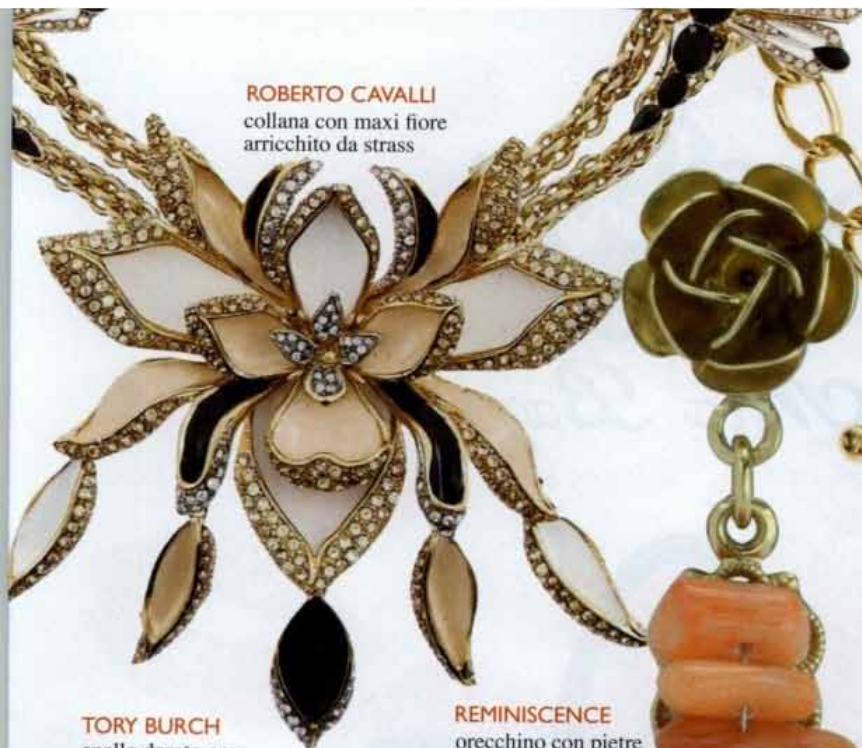
ROBERTO CAVALLI collana con maxi fiore arricchito da strass